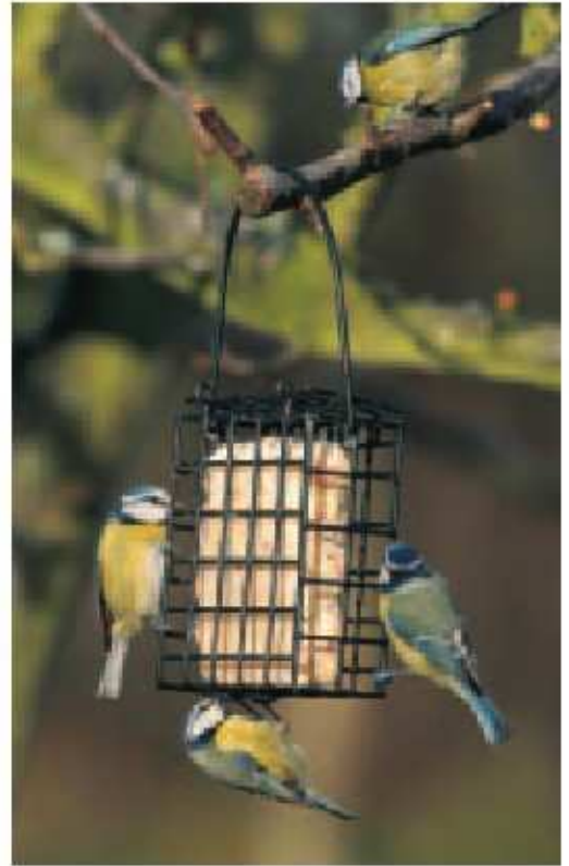
1 SF Suet Feeder Comedero especialmente diseñado para los pasteles de sebo JACOBI JAYNE. Tiene una asa para colgarlo

El sebo es un alimento tradicional muy valorado por su alto contenido energético y muy apreciado por aves como el pico picapinos, los trepadores azules y los carboneros. Nuestros pasteles de sebo son fáciles de manejar y muy atractivos para las aves.