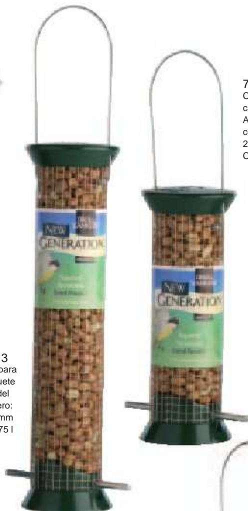
JP-2G 3 Comedero para cacahuete Altura del comedero: 300 mm Capacidad: 0,75 l