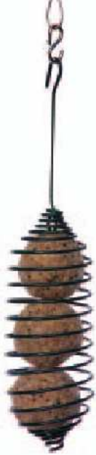
1 SB-SP Comedero tipo espiral para bolas de sebo de 100 g Especialmente diseñado para albergar 3 bolas de sebo de 100 g de Jacobi Jayne. Fabricado en acero recubierto de goma, con un pequeño gancho para colgar. La bola se coloca en su interior sin la malla de plástico que le acompaña (las bolas de sebo no están incluidas).