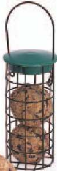
SB-TB Comedero tipo cesta para bolas de sebo de 100 g para aves silvestres 3 Especialmente diseñado para albergar 2 bolas de sebo de 100 g de Jacobi Jayne. Fabricado en acero recubierto de goma, con una pequeña cadena para colgar. Las bolas se colocan en su interior sin la malla de plástico que le acompaña (las bolas de sebo no están incluidas).