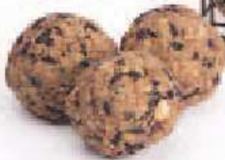
7 SB-6 Pack de 6 bolas de sebo de 100 g Nuestras bolas de sebo son fáciles de manejar y muy accesibles para las aves. Su presentación permite utilizarlas directamente colgadas con su malla de plástico, pero le recomendamos nuestros comederos para bolas de sebo "SB-SP" tipo espiral o "SB-TB" tipo cesta, sencillos, muy fáciles de utilizar y limpiar y elegantes. Peso neto: 100 g cada bola.